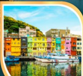
ท่าเรือเจิ้งปิ่น