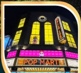
ร้านPOP MART ที่ใหญ่ที่สุดในไต้หวัน