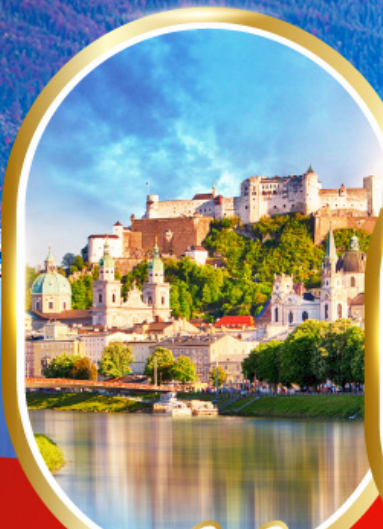
ซาลส์บวร์ก