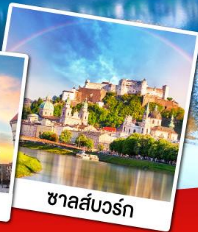
ซาลส์บวร์ก