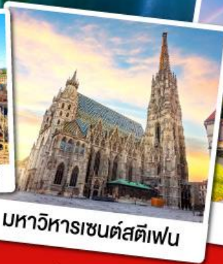
มหาวิหารเซนต์สตีเฟน