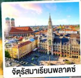
จัตุรัสมาเรียนพลาตซ์