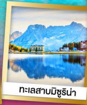
ทะเลสาบมิซูริน่า