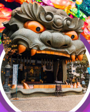
ศาลเจ้านิมบะ ยาชากะ