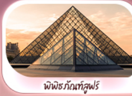
พีพีร์กับทูลูฟวร์