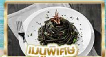
เมนูพิเศษ