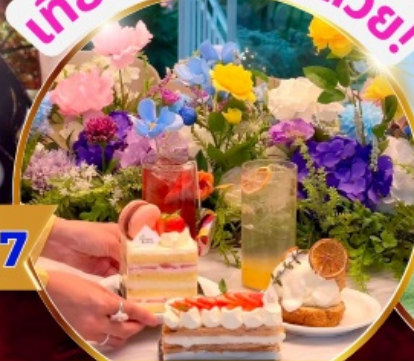
คาเฟ่ดัง Forest Outing