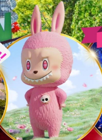
Pop Mart สงแด