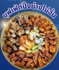
บุฟเฟ่ต์ปิ้งย่างไม่วัน