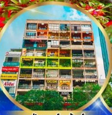
คาเฟ่ อพาร์ทเมนต์