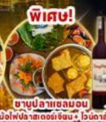
ซาบูปลาหมอลอน หม้อไฟปลาสดอร่อยเข้มข้น + ไวน์ดิลิต