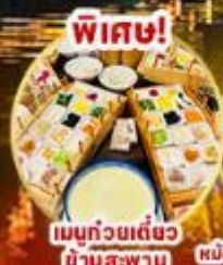
เมนูถ้วยเต๋อซว๋ ซ้ำมสะพาน