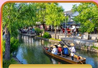
เขตอนุรักษ์คุราชิกิ