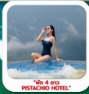
"พัก 4 ดาว PISTACHIO HOTEL"