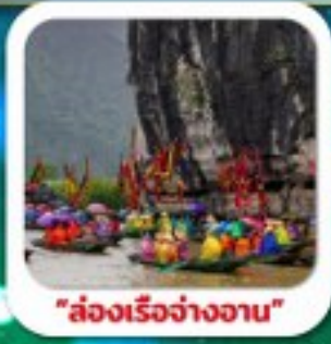
"ส่องเรือจ้างอาน"