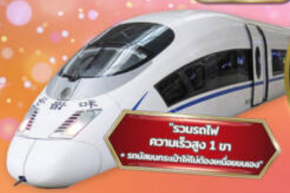
"รวมรถไฟความเร็วสูง 1 ท. + รถบริการกระเป๋าขึ้น-ลงขบวนรถไฟ"