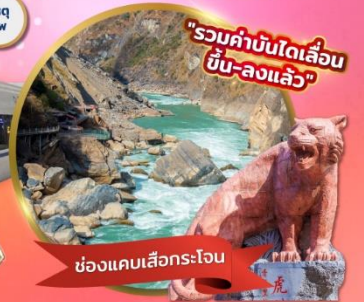
"รวมค่าบัตรรถไฟความเร็วสูง ขึ้น-ลงแล้ว"