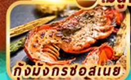
กุ้งมังกรชอสนาย