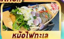
หม้อไฟทะเล