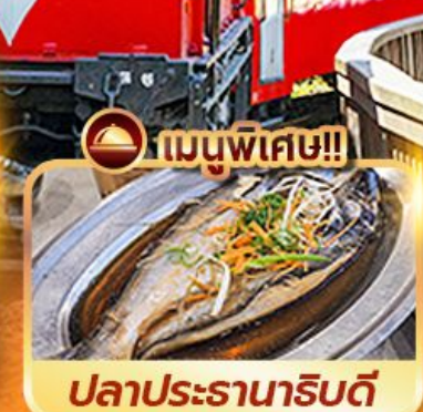
เมนูพิเศษ!! ปลาประดานาธิบดี