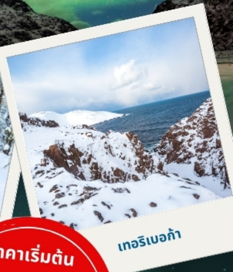
เทอริเบอก้า