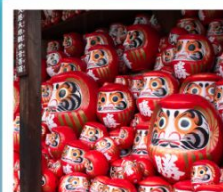
วัดคิตสึโอจิ