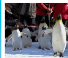
สวนสัตว์นิกเซ่

วัดคิตสึโอจิ / ปราสาทโอซาก้า / ย่านชินไซบาชิ ค่องเรือทะเลสาบโทยะ / โทริยวคะคุ ทาวเวอร์ โทดิงอิซูแดงคามโมริ / นั่งกระเช้าภูเขาฮาโกดาเตะ ตลาดเช้าเมืองฮาโกดาเตะ / สวนสัตว์นิกเซ่ มารีเนอพาร์ค พิพิธภัณฑท์ก่องดนตรี / นาฬิกาไอน้ำโบราณ โรงเป่าแก้วคิตาอิชิ / เนินพระพุทธรเจ้า / มิซึย เอ้าเค็ทท์