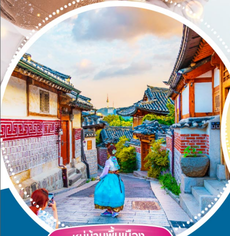
หมู่บ้านพื้นเมืองพูซอนอันนุก