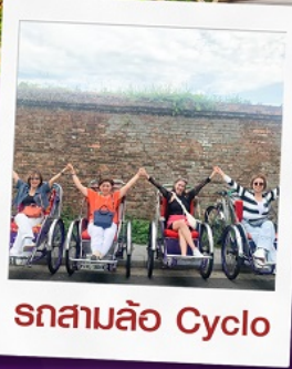
รถสามล้อ Cyclo