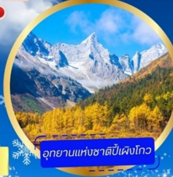
อุทยานแห่งชาติหนีเป่ิงโกว