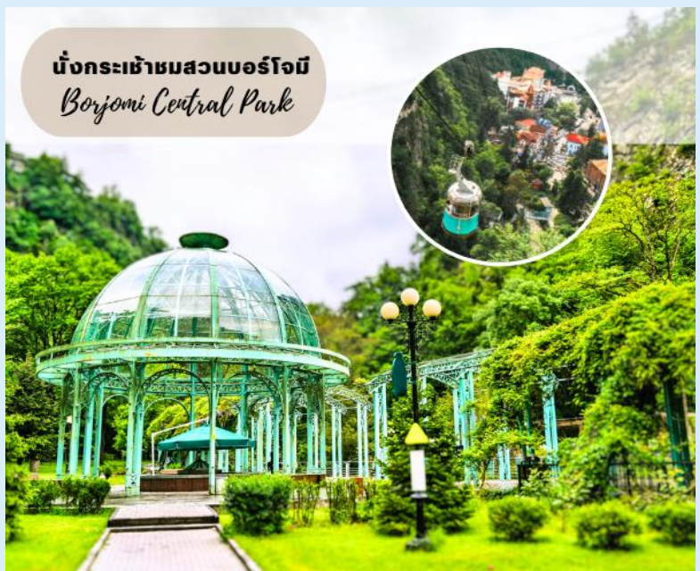
นั่งกระเช้าชมสวนบอร์โจมี Borjomi Central Park

โดยการแช่น้ำแร่ในวันหยุด จากนั้นนำท่านนั่งกระเช้าสู่จุดชมวิวบนหน้าผาเหนือสวนบอร์โจมี