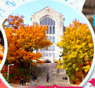
มหาวิทยาลัยฮ็ชวา