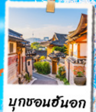
มูกซอนฮันจอก