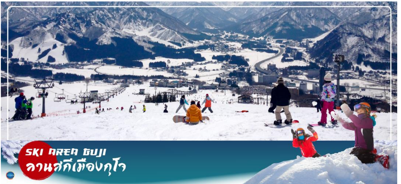
SKI AREA GUJO ลานสกีเมืองกุโจ

วันที่สาม เมืองกุโจซาจิมัง – ลานสกีเมืองกุโจ – เมืองกิฟู – หมู่บ้านมรดกโลกชิราคาวาโกะ – เมืองทาคายามะ – ถนนชั้นมาจิซุจิ – เมืองนาโกย่า