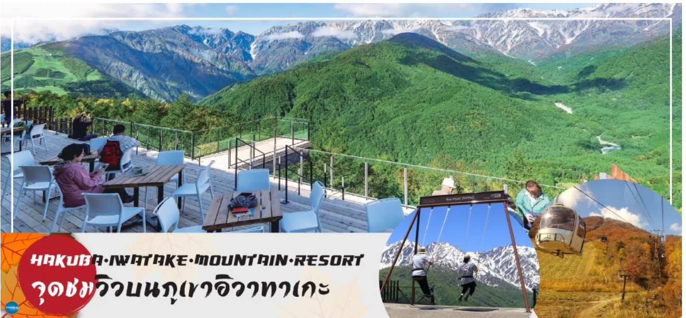
HAKUBA IWATAKE MOUNTAIN RESORT จุดชมวิวนภูเขอิวาทาเกะ

วันที่สี่ เมืองมัตสึโมโตะ – เมืองนากาโนะ – ฮาคูบะ – HAKUBA IWATAKE MOUNTAIN RESORT (คอนโดล่า ลิฟท์) – ไร่อาซาฮิไดโอะ – เมืองยามานาชิ – อุโมงค์ไบเมเบิล (ขึ้นอยู่กับฤดูกาล) – หมู่บ้านโอชิโนะสั๊กไก – ออนเซ็น + ชาบูยักษ์