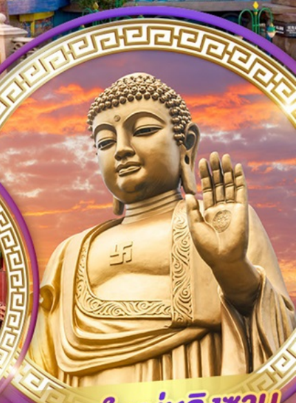
พระใหญ่หลิงซาน