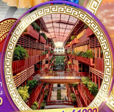
The street of 1000 red jars