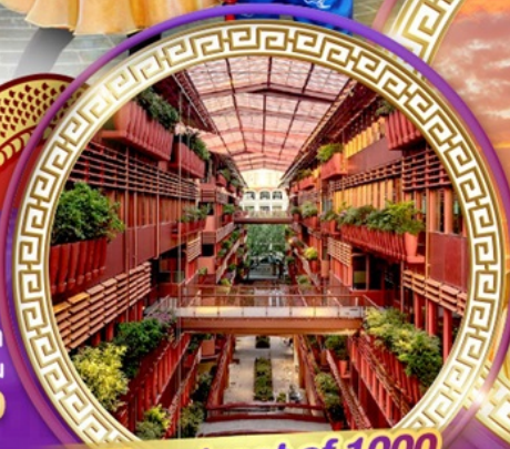
The street of 1000 red jars

สักการะพระใหญ่หลิงซานต้าฟอ ถ่ายรูปคู่กันดั้มยักษ์ ชมสุดยอดพุทธศิลป์ร่วมสมัยของจีน "ศาลาฟานกง"