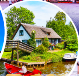
หมู่บ้านกีธูร์น