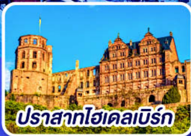
ปราสาทโฮเดลเบิร์ก