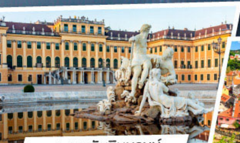
พระราชวังเซินบรุนน์

สวຍครบ ยุโรปตะวันออก เยอรมนี เชก สโลวาเกีย อังกาเรี ออสเตเรีย 10 วัน 7 คืน