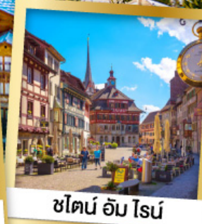
ชไตน์ อัม โรน์