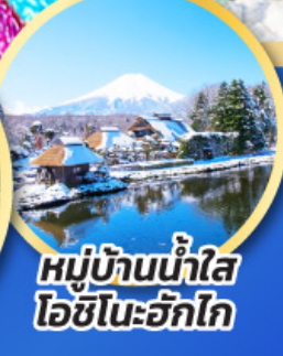
หมู่บ้านน้ำใส ไอชิโนะอัทสึ