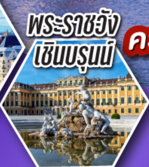
พระราชวัง เซินบรุนน์