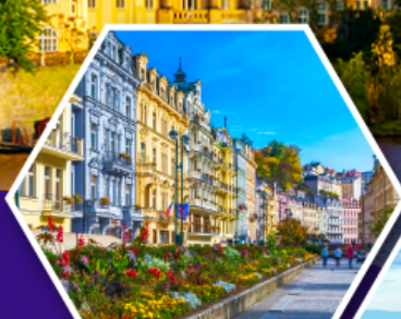
คาร์ลสไบร์