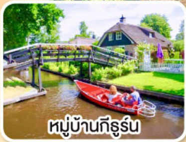
หมู่บ้านทีร์น