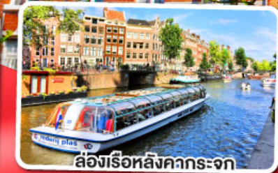
ล่องเรือหลังคากระจก