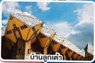
บ้านลูกเต่า