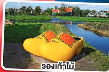
รองเท้าไม้