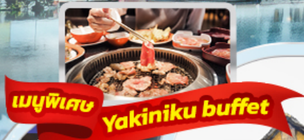
เมนูพิเศษ Yakiniku buffet