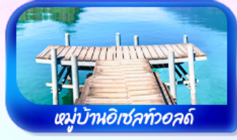
หมู่บ้านอิเซลท์วอลด์