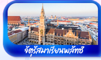
จัตุรัสมาเรียนพลัทซ์