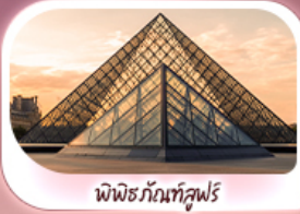
พิพิธภัณฑลุ่มฟูร์