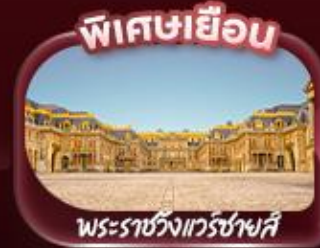
พิศขะเยื่อน