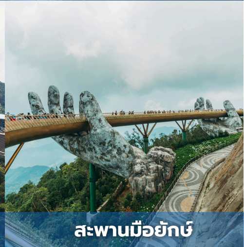
สะพานมือยักษ์