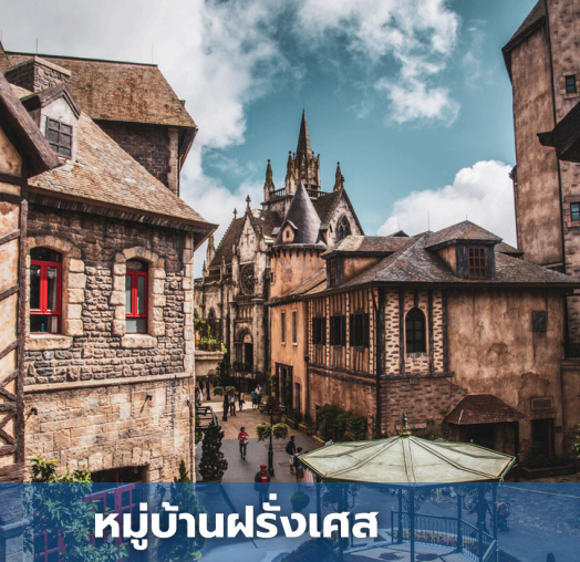
หมู่บ้านฝรั่งเศส