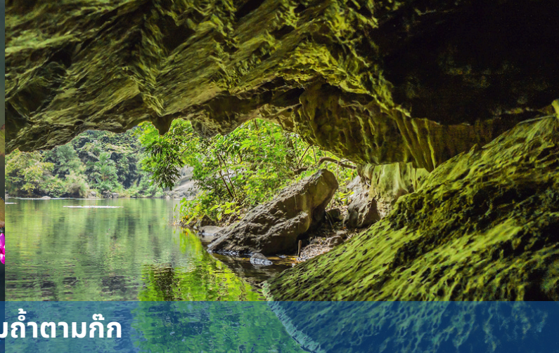
ล่องเรือชมถ้ำตามก๊ก