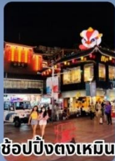
ช้อปปิ้งตงเหมิน