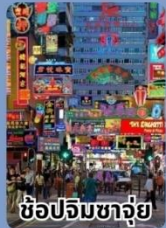
ช้อปปิ้งชาจ่วย