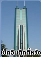
เซินเจิ้นตึกตีห้วง