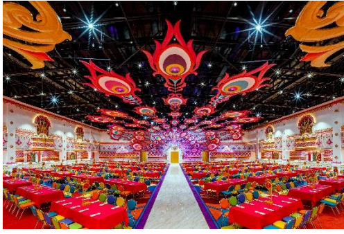
หลังอาหาร ชมการแสดง