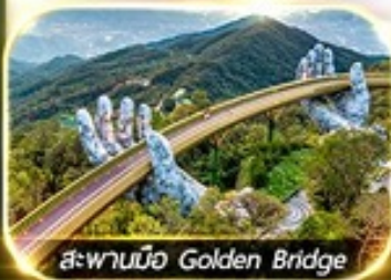
สะพานมือ Golden Bridge