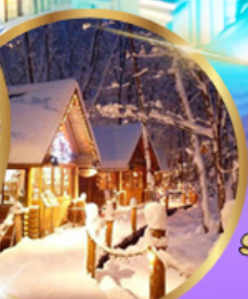
หมู่บ้านเทพนิยาย นิงเกิ้ลเทอเรส

เดินทาง 01 - 06 กุมภาพันธ์ 68 02 - 07 กุมภาพันธ์ 68