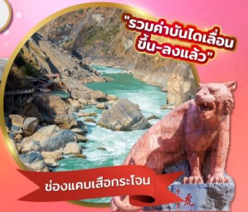
"รวมค่าบัตรรถไฟความเร็วสูง ขึ้น-ลงแล้ว"