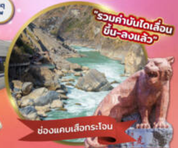
"รวมค่าบันไดเลื่อน ขึ้น-ลงแล้ว"