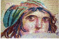
พิพิธภัณฑสถานแห่งชาติซูมา โมเสก