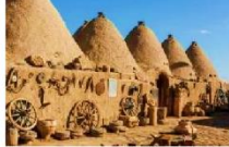
บ้านแบบรวงผึ้ง