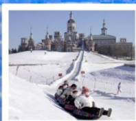
ฤดูหาลานวอลการ