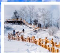
เขากระหลว้า