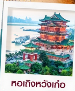
หอถึงหวังเก้อ