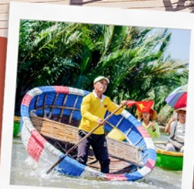
ล่องเรือกระด้ง