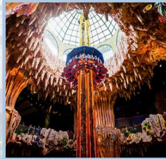
สวนสนุก Fantasy Park