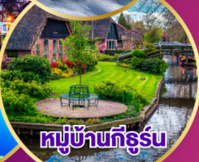
หมู่บ้านที่รูร์

เดินทาง 30 เม.ย.-09 พ.ค. 68 03-11 พ.ค. 68