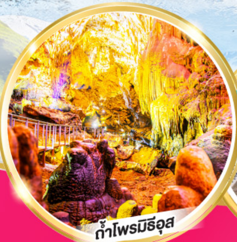
ถ้ำไฟมณีรุส